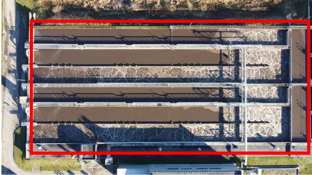
Pav. 3.1 Aeracinis blokas

Aeracinis blokas - biologinio nuotekų valymo įrenginys.