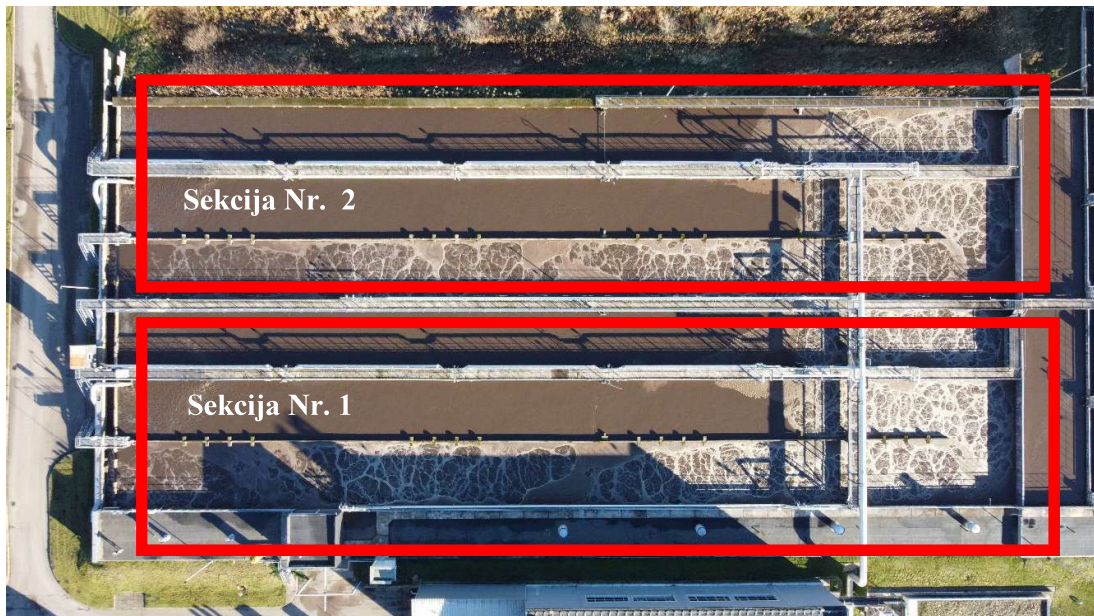
Pav. 3.2 Sekcija Nr. 1 ir Sekcija Nr. 2

Sekcija – Aeracinio bloko dalis (Nr. I ir Nr. II).